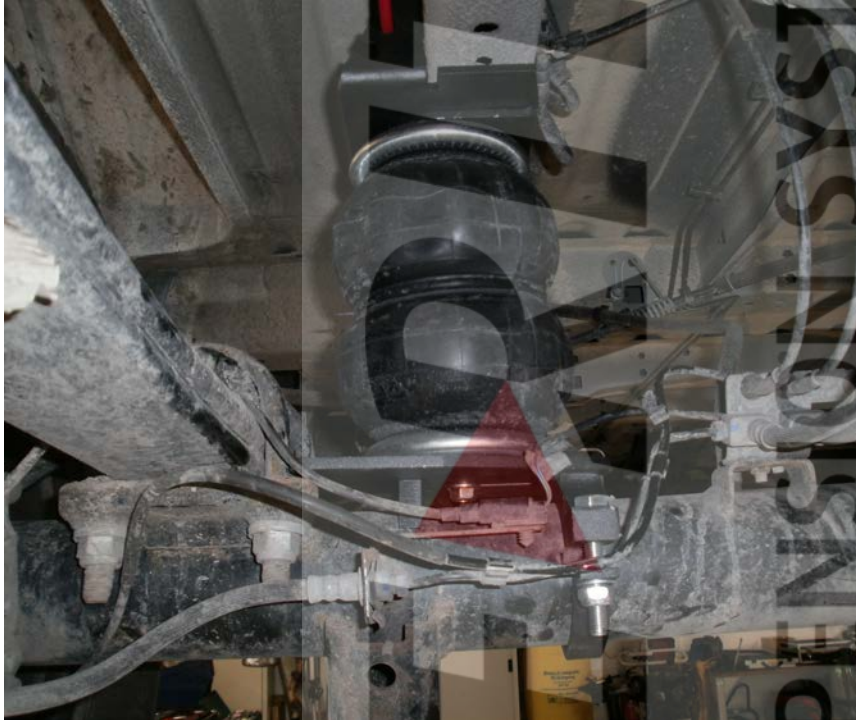
Bild 1: Zusatzluftfedersystem Hinterradantrieb mit Einzelbereifung