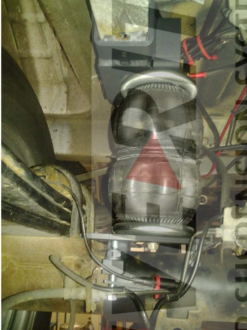
Bild 4: Zusatzluftfedersystem Hinterradantrieb, zwillingsbereift (Ansicht 2)