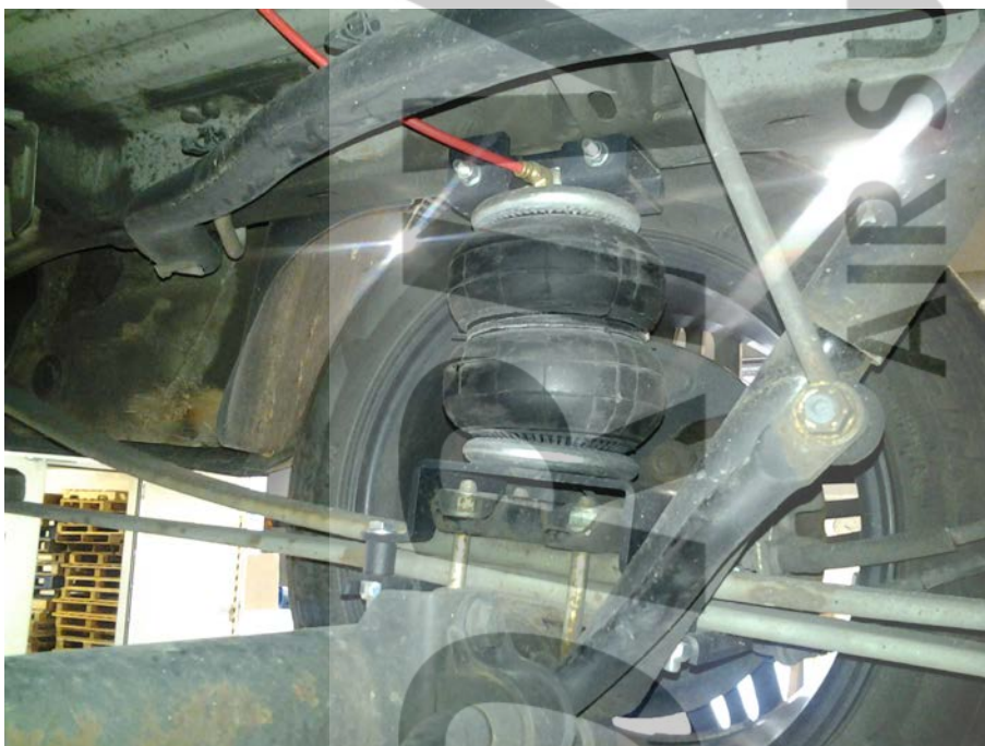
Bild 1: Ansicht Zusatzluftfeder im eingebauten Zustand (ausgefедert)